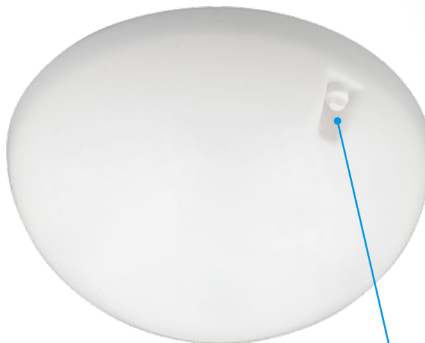
ULW-K20A / ULW-K20C