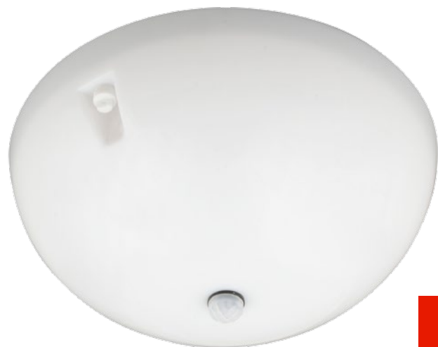
ULW-K20B / ULW-K20D с датчиком движения

Светильники светодиодные влагозащищенные антивандальные серии ULW-K20 предназначены для внутреннего освещения помещений ЖКХ, общественных и административных зданий и сооружений, вспомогательных помещений жилых домов (подъездов, холлов, подвалов и т. п.), подсобных и складских помещений, коридоров, входных групп и лестничных пролётов. Изготавливаются в исполнении УХЛ 1.