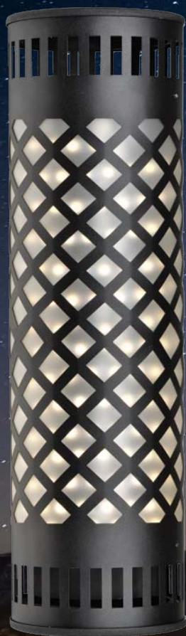
ULO-K07 V/4000K/6500K/UVCB D01 BLACK/GREY/STEEL