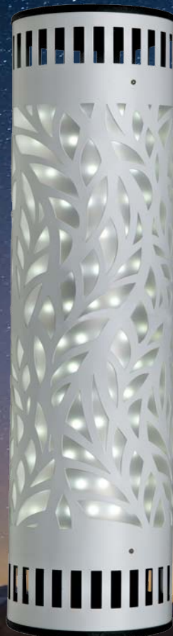
ULO-K07 V/4000K/6500K/UVCB D02 STEEL/GREY/BLACK