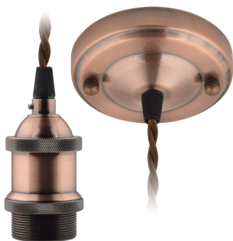
DLC-V-S22K/E27 TS/1,5M/BL BRONZE

Артикул UL-00005286 Мощность, Вт 60 Цоколь E27 Бренд Uniel